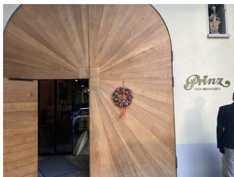
訪問先は「Thomas Prinz」という酒造メーカー。リンダウ周辺のドイツとオーストリアの国境付近に位置しています。

営業1課の平田です。FAKUMA展示会初日の夜、現地の代理店にシュナップス（Schnaps）工場の見学へ連れて行っていただきました。シュナップスとは主にドイツやオーストリアなどの欧州で飲まれる蒸留酒です。シュナップスにはさまざまな風味があり、リンゴ、洋ナシ、桃、プラムなど、さまざまな果物から作られるものがあります。アルコール度数は比較的高めで、20度から40度程度のものが一般的ですが、中にはもっと高いものもあります。そんなシュナップスですが、その風味を楽しむために、冷たい状態でストレートで飲むことが一般的です。アルコール度数が高い割にマイルドな味なので、飲みすぎには注意が必要です！