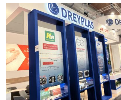
喜多村ブース (DREYPLAS展示ブース内)