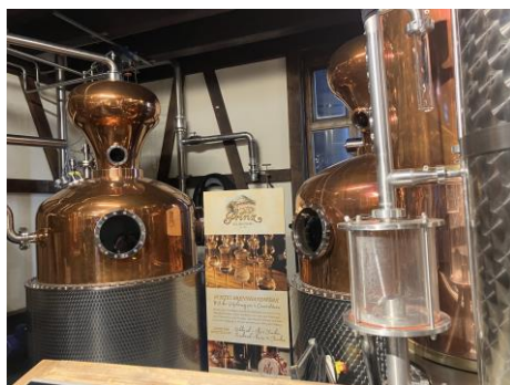
蒸留を行う際に使用する機械。この工程で、アルコール成分を取り出した蒸留液と残渣の発酵液に分離されます。