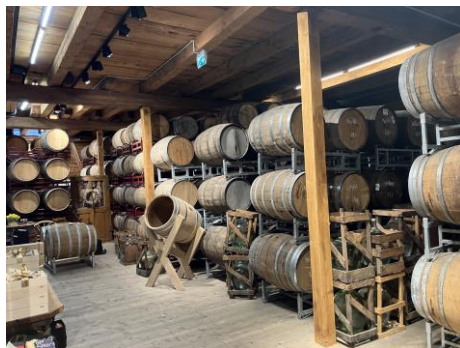
取り出された蒸留液は樽で熟成されます。この樽はカスクと呼ばれ、使用する木材の種類によっても味が変化します。