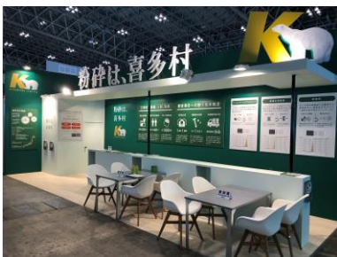
弊社展示ブース外観

2019年12月に幕張メッセで開催されました、第8回高機能プラスチック展に出展いたしました。今回はブース面積を1.5倍に拡大し、従来の“実績”に重きを置いた展示内容から“相談”を重視したオープンカフェのようなスタイルに変更してみました。3セット配置した商談席はフル活用の大盛況。弊社ブースにお越しくくださった皆様、貴重なお時間をいただき、ありがとうございました。