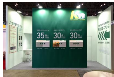
弊社展示ブース外観

2018年12月に幕張メッセで開催されました、第7回高機能プラスチック展に出展いたしました。 今回は展示内容を従来から大きく変更し、“材料は粉碎することで高付加価値になる”を前面に押し出したところ、多くのお客様からお問合せをいただくことができました。弊社ブースにお越しくくださった皆様、貴重なお時間をいただき、ありがとうございました。